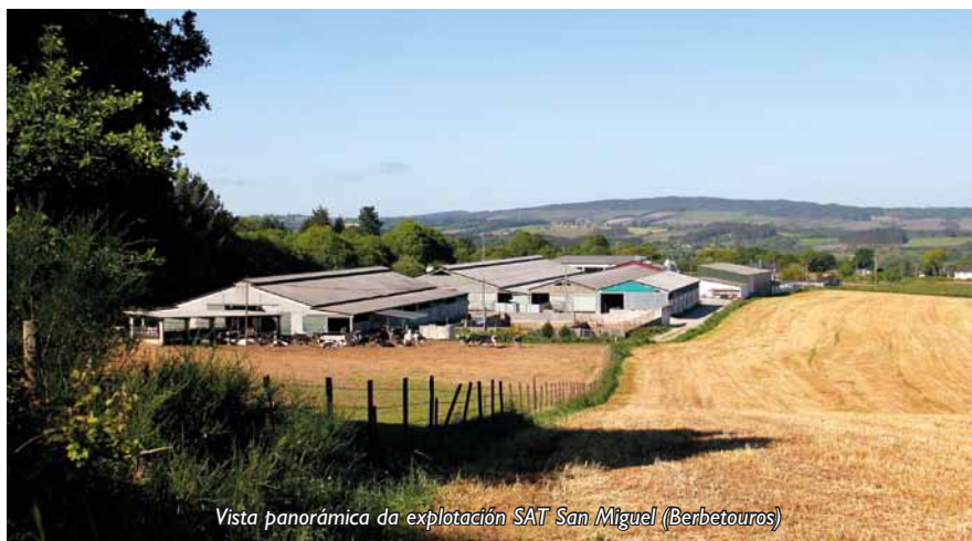
Vista panorámica da explotación SAT San Miguel (Berbetouros)